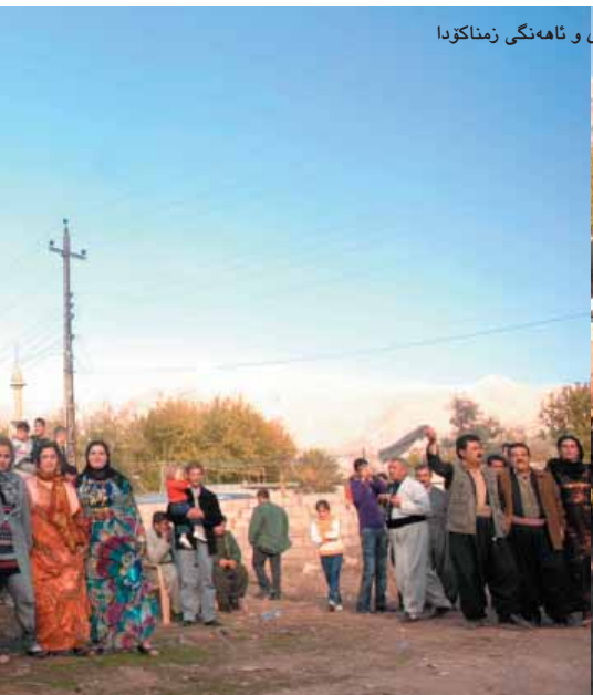
گوندی کۆلکن له بيشوازی و ئاههنگی زمناکۆدا

له گه ل زمناکۆ پیاویکی بالا به رزی ئیرانى هه لده په پرى، ئە م پیاوه هه بیب هه مید پور، خالی ئیرانى عه لی بوو. ئە و وتى: (ئیمه له هه موان خوشحالتین، ئاخ