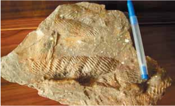
وئەنە (۶) شوئەنە وارى بەر دېبوو ترابىلۇبايت كەشئوھە رۆشتنى پىشانده دات، گوندى كىستا، زاخۇ، دھوك.