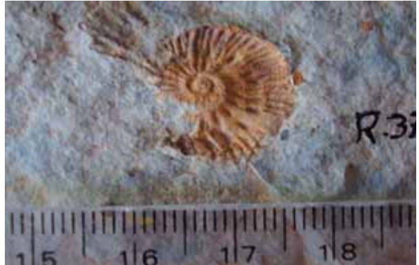
وئەنە (۱) ئەمۇنايت كەبەئۇكىسىدى ئاسن پېرېوتەو، گوندى ھەنجېرە، رانپە، سلىمانى