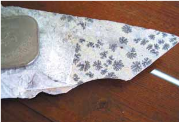
وئەنە (۸) ئەم خاوەشئوھە درەختيانە، بە بەر دېبوو درئىنە ناو دەبرئىن و بەر دېبوو نىن، گوندى كانى بەردىنە، سلىمانى.