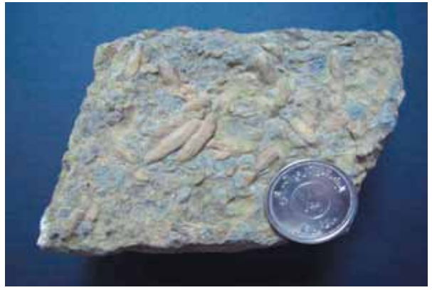
وئەنە (۴) بەر دېبوو فۇرامنىفئرا، درىژكۆلەكان برىتەن لە لەفئوزيا و پانەكانىش ئۇمفالۆسايكەس، گوندى چالگە، سلىمانى.