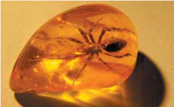
وئەنە (۷) جالجالۆكە يەك لە ناو زەردووييدا. لىرە دا گشت بەشەكانى زىندە وەرەكە ھەلدە گېرېت و دە پارىزىت.