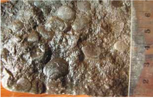
وئەنە (۵) لە بەر دېبوو لە چىنە كىلىسىيە پەشباوھەكان، گوندى سەرگەلو، سلىمانى.