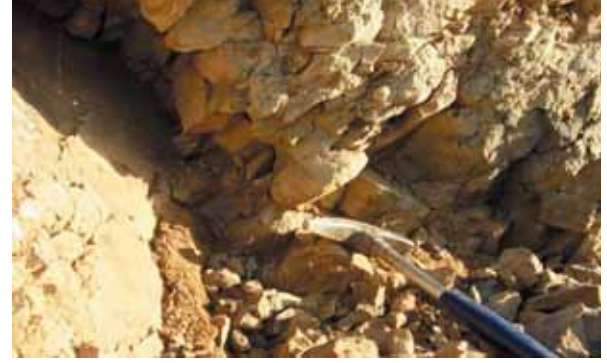
وئەنە (۲) بەر دېبوو كى پىست دركاوييەكان پىش دەرىئاننى لە چىنە بەردەكاندا، سەيرى كۆتايى سەرى چەكوشەكەبگە، گوندى زەردەبى، سلىمانى.