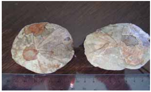
وئەنە (۳) دوو بەر دېبوو كۆمەلە پىست دركاوييەكان پاش دەرىئاننان لە چىنە بەردەكانى كوردستاندا، گوندى زەردەبى، سلىمانى.