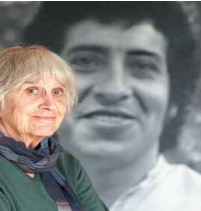
خوان توبىر نىرى ھاۋسەرى فېكتۇر خارا

لەرۇژى ۱۱/۹/۱۹۷۲دا نۆگىستۇ پىنۇشى بەيارمەتى دىزگا سىخۇرەكانى ئەمىرىكا كودەتايەكى خۇنپاۋى دژى حكومەتى نىشتمانى بەسەرگىدەيتى ئەلپىندى بەرپاكر كە لەلايەن جەماۋەرى شىلىپەۋە ھەلپۇردىراپو، سوپاكەى پىنۇشى بەتانك ۋە چەكى قورس ۋە ھەلىانكوتايە سەرپەرلەمان ۋە كۆشكى كۆمارى ۋە لەشەپكى خۇنپاۋىدا سەرۋك سلفادۇر ئەلپىندى ۋە زۆرىەى ۋەزىرەكەسە نىزىكەكانى كورژان. فېكتۇر خارا، لەگەل چەند ھاۋرپىيەك ۋە قوتابىيەكانى بەرەۋ