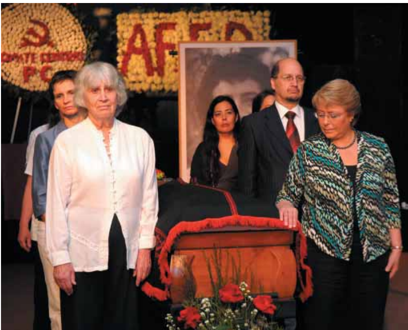
میشیل باشلی سەرۆکی چیلی، لەمەراسیمی بەخاکسپاردنى خارا

خارا ۳۴ گوللەى بەرکەوتبوو، لەگەڵ پینچ هاوڕێی تریدا بەشێوهیهکی نیچە نەینى کەسوکارەکانیان لەدامینى گۆرستانیکدا بەخاکیان سپاردن. خارا تەنها دە رۆژ پيش یادی ۴۱ ساله‌ى لەدایکبوونهکەى بە درێندەترین شێوه شەهید کرا، ئاستى هونەرەکەى گەیشتبوو و لوتکەو بەپەنجەکانى